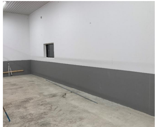
Och så fint blev det när det var färdigt