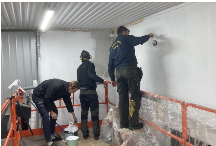
Här målar några av juniorer väggarna i Gårdsverkstaden