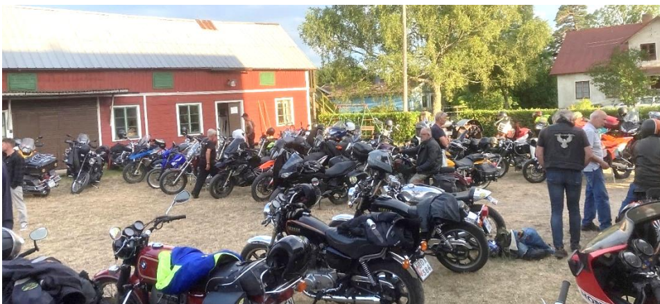
Storgården full av gamla och nya dyrgripar

Den 21 juli var det Moped o MC träff, det kom mellan 90—95 tvåhjulingar och 140 andra besökare denna fina sommarkväll. Som vanligt går Rune Larsson och interjuver moped- och mc-ägarna så vi