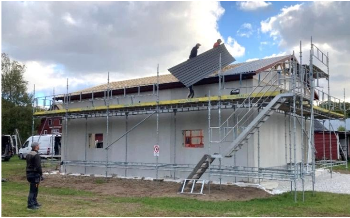
Här läggs plåttaket på.