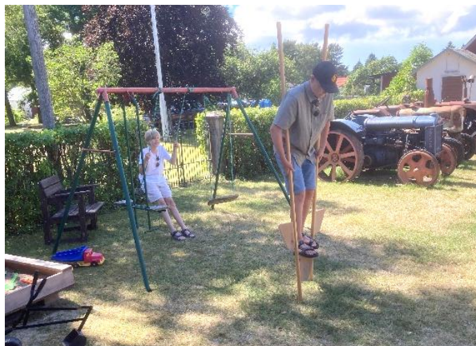
Även barn har roligt på Lantbruksmuseet. Kanske är det barnaktiverna vi ska öka för att få fler besökare?