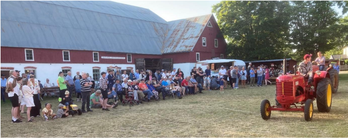
Här är två Massey Harris är in för presentation på taktorparaden