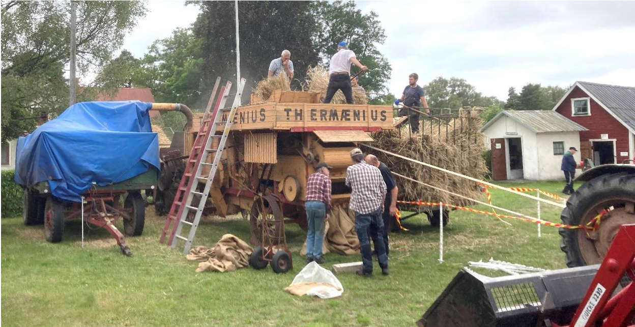
Tröskning pågår den 6 september