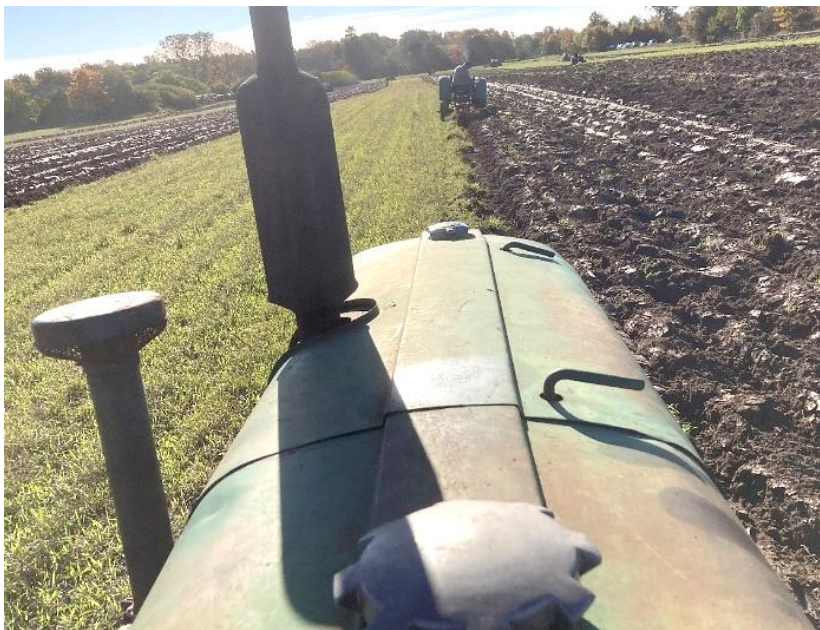
Utsikt från BM 36 under veterantraktorplöjning