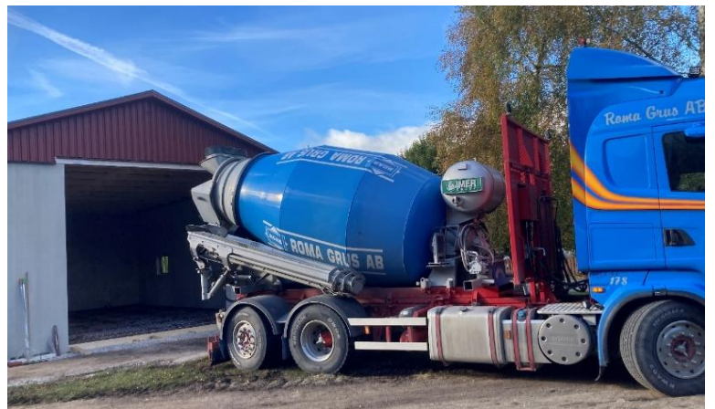
Bilen med cement kom den 15 oktober då det göts cementgolv i Gårdsverkstaden