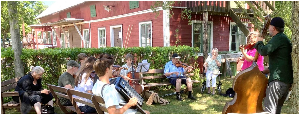
Spelmansträff i trädgården på Lantbruksmuseet