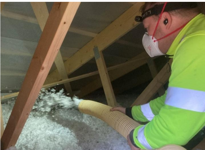
Här blåses det in 35 cm isolering över taket utav Gotlands byggisolering AB