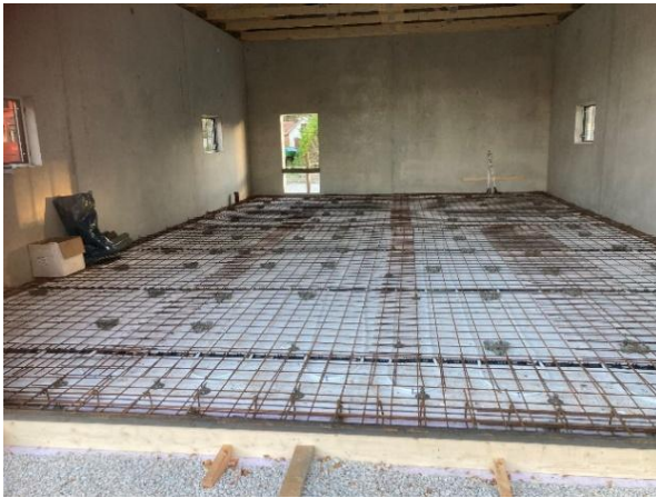
Här har är armeringsjärnen på plats.