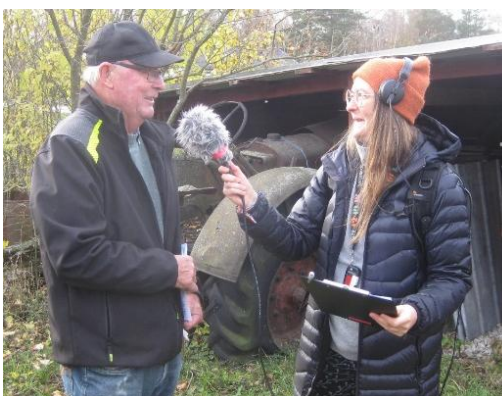
Och jag fick också var med

Har en fundering, för GT o GA var det kanske inte intressant att det kommit pengar till landsbygden. Kanske för långt att åka för ett reportage från Visby? Arvsfond la ut händelsen på sin Facebooksida, de har 12 000 följare står det. Sök på deras Facebooksida om ni vill se vad de skrev.