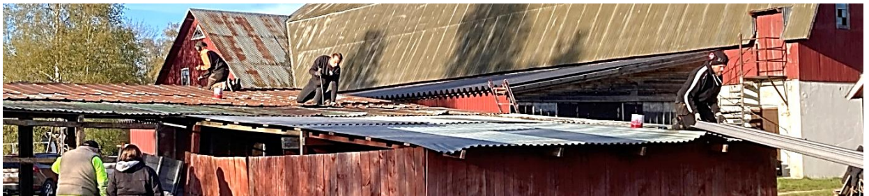
Juniorerna fick förtroendet att ta av plåten