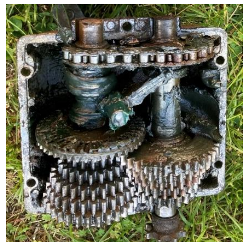
Så här ser en växellåda ut