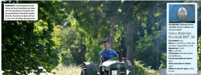
KLASSISER: Borden skapas till BMJ och för tradition och Volvo Bolander-Munktel BMT 36 är modernare i vissa delar. Men i en översikt är de båda traktorer, till exempel, av samma slag. VIKT: 4 000 kilo. TILLHÖRANDE: En Volvo Bolander-Munktel BMT 36. FÖRSTA EXEMPLAREN: Utvecklade av Edsbyn. Skapas exempelvis utifrån: Vissa traktorer som ny utgåva av den klassiska.

REKREATION: ANNIKA BUCHHELD/ANNA BUCHHELD