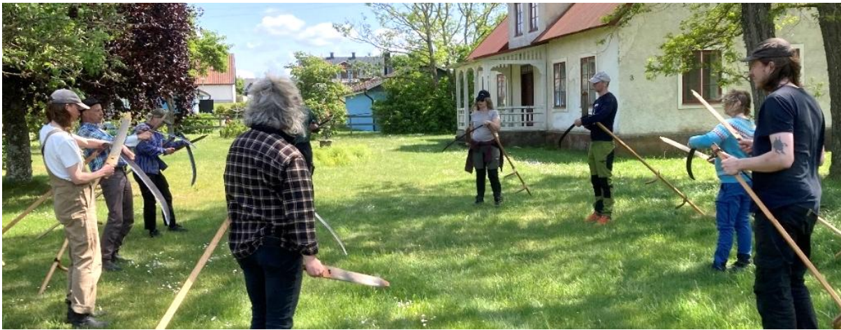
Här tränar man att vässa lien med Sigdespån