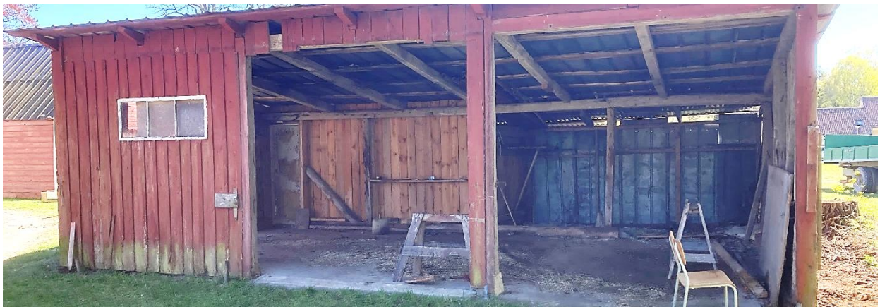
Vi har tömt gamla garaget inför nybygget av gårdsverkstad.