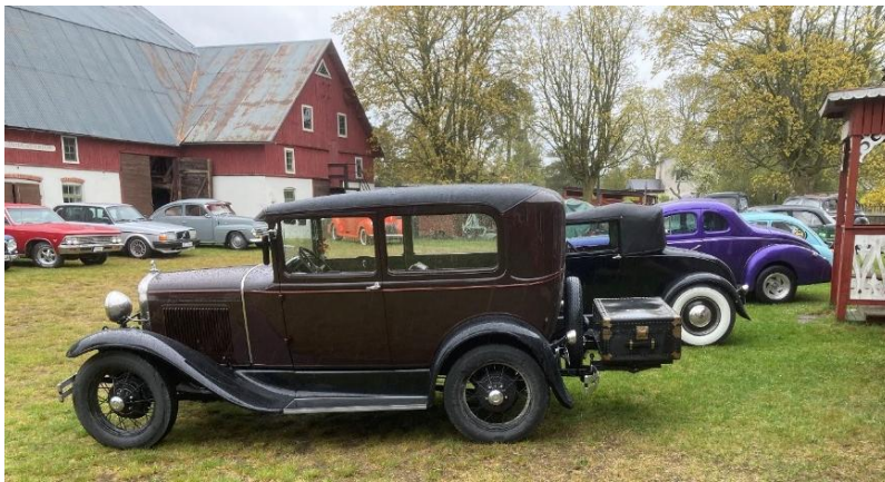
En helg i maj var det målgång för en veteranklubb på Lantbruksmuseet. Det var många fina gamla bilar som kom in på vår storgård, där det avslöts med kaffe i "konferensvåning" då det regnade.