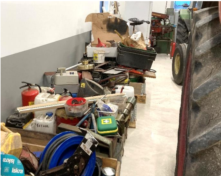
Här står pallar med prylar som ännu skall sorteras