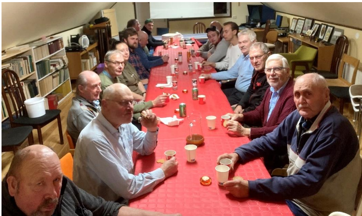
12 december bjöds Gubbdagis och Juniörerna på Jultallrik som här avrundas med kaffe och pepparkaka

Det är planerat en fortsättningskurs i vår av start och skötsel av de stora stationära motorerna.