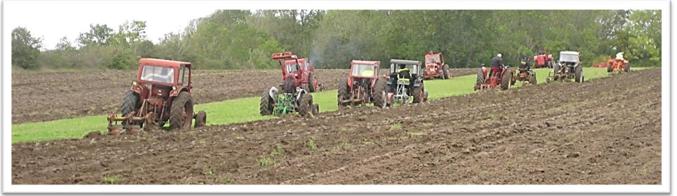
Från plöjning vid Lingvide