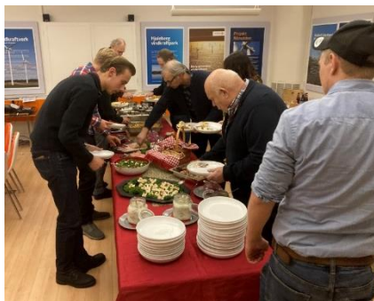
Här bakar några av Gubbdagis och juniorerna en välförtjänt jultallrik ute på Näsudden i byggnaden för vindkraftsinformation 6 dec

Något som vi måste bli bättre på är att få fler besökare när vi har öppet på Lantbruksmuseet. Våra andra arrangemang tycker jag vi lyckas rätt bra med. Där tror vi att genom att vara mer aktiva på sociala medier är en möjlighet. Två i styrelsen har varit med på en digital kurs som Arbetslivsmuseet höll om sociala medier. Vi får se vad den kursen med tips om olika möjligheter att jobba med sociala medier kommer att ge, förhoppningsvis kommer det att påverka besöksantalet i positiv riktning.