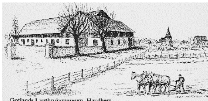
Gotlands Lantbruksmuseum, Havdhem

Vänliga hälsningar från styrelsen i Stiftelsen Gotlands Lantbruksmuseum