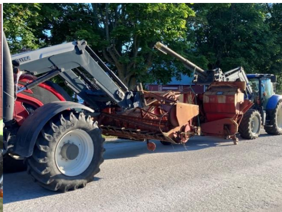
Här kör juniorerna med den utdömda JF tröskan upp till godsmagasinet för inväntan på skrotning

Vi har nu färdigställt bygglovshandlingarna för vagnslidret och verkstad. Verkstaden kommer att ligga där gamla garaget är idag och vagnslidret söder om. Vi har skickat bygglovs-handlingarna till Regionen under februari. Museet ligger inom detaljplanerat område så vi måste ha bygglov. Skall bli spännande och se var de har för synpunkter på det.