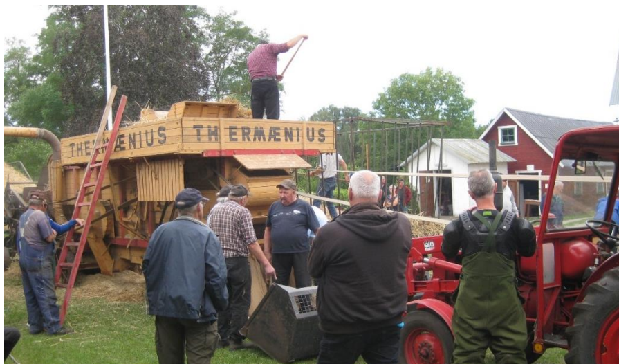
Bild från tröskdagen den 3 september 2022