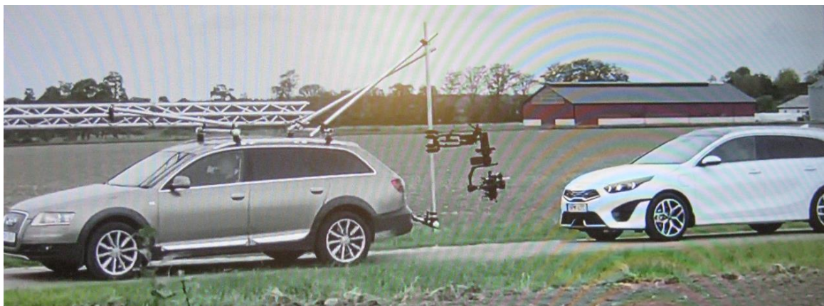
Bilmärket Kia som spelar in reklamfilm i Bols kvior i Havdhem under hösten 2021

Bilden kanske inte hör hit men det var en lite ovanlig händelse här ute.