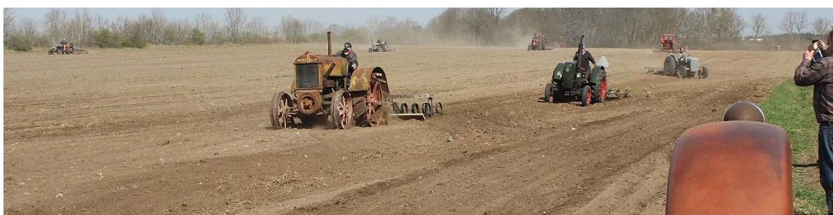
Förra året blev det inget vårbruk men det hoppas vi på i år. Bilden från 2020

Medlemsavgift på 200 kr till Museets Vänner ger dig vissa förmåner. Styrelsen beslöt 2013 efter ett förslag, att du som medlem får vistas gratis på Museet utom när vi har några extra arrangemang då betalar även du. Som medlem är du givetvis välkomna till vår årliga grillkväll. Hoppas ni är nöjda med det, för vi är beroende av ert stöd och arbete för att hålla igång och underhålla Lantbruksmuseet. Tack ska ni ha för att ni ställer upp.