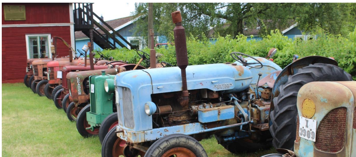
Kan vi få bygga ett vagnslider kan vi ha flera traktorer under tak på sommaren

Sågmotorn går igen. Nu hoppas vi under våren kunna dra igång den uppskjutna utbildningen att lära ungdomar och andra intresserade att starta de stationära motorerna vid sågen.