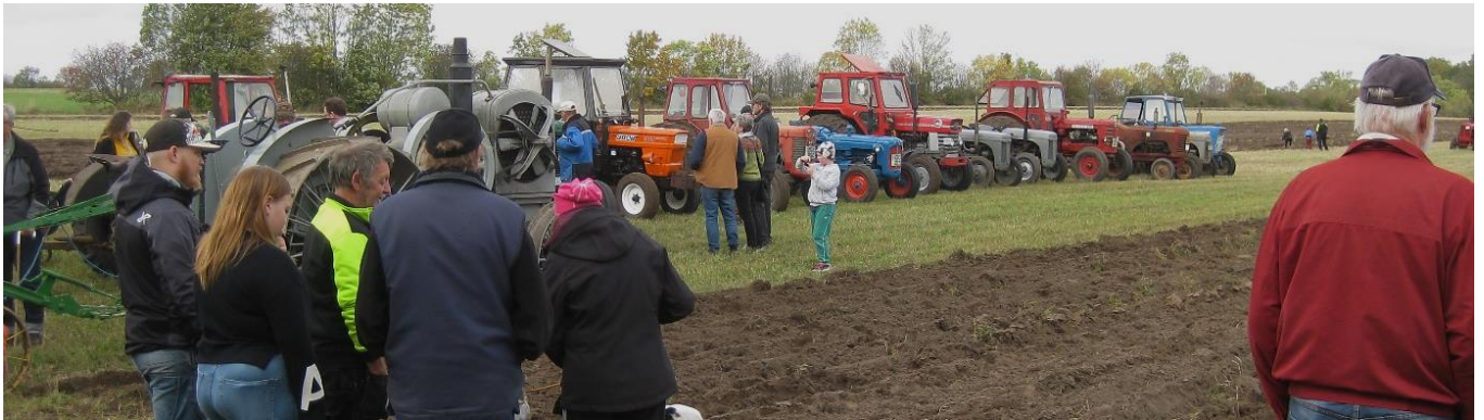
Traktorerna uppställda för presentation vid plöjningen i höstas